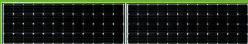
B:横配置・横2枚 <1段2列>