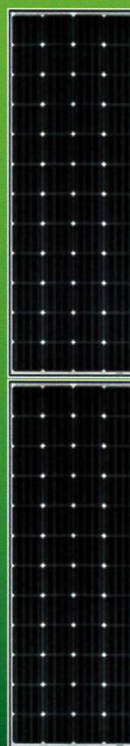
D:縦配置・縦2枚 <2段1列>